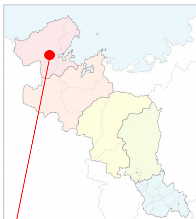
京丹後市大宮町三重・森本地区