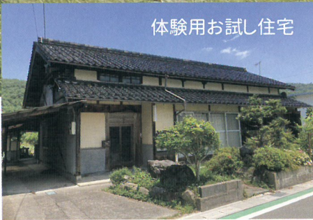
体験用お試し住宅

岩屋地区では、リフォームにかかる費用など、最大 180 万円の補助を受けられます。