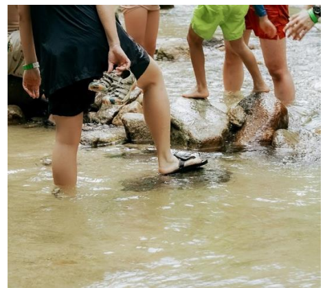
※天女の里でのイベント(サウナ祭)の様子