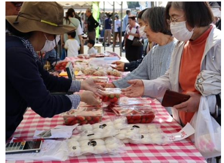
※五箇プロジェクトによる朝市の様子